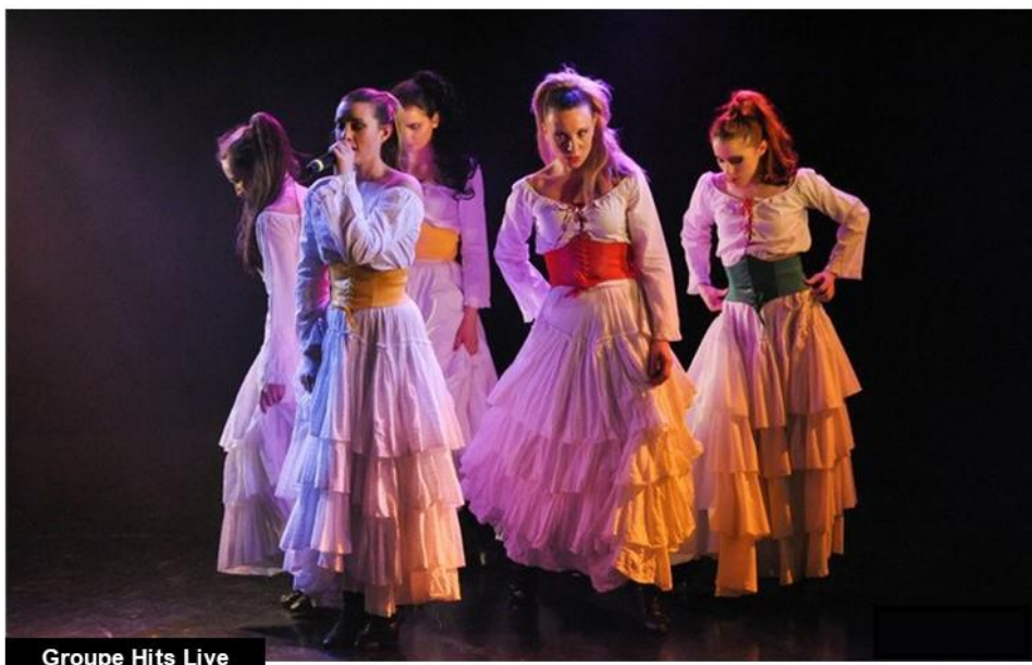
Groupe Hits Live

Ensuite, laissez-vous transporter par le groupe Hits Live pour un voyage au cœur des plus grandes comédies musicales. De West Side Story à Robin des Bois, en passant par Roméo et Juliette, 1789, Mozart, Notre-Dame de Paris, Les Dix Commandements, Starmania, Grease, et même Les Blues Brothers. Un show plein d'entrain, de jeunesse avec des chorégraphies, des costumes colorés et une mise en lumière soignée pour une immersion totale.