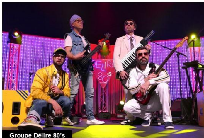
Groupe Délire 80's

En fin de journée, le Comité des Fêtes organisera un spectacle gratuit, offrant ainsi une après-midi de détente après l'effort pour les randonneurs et leurs accompagnants (voir page suivante).