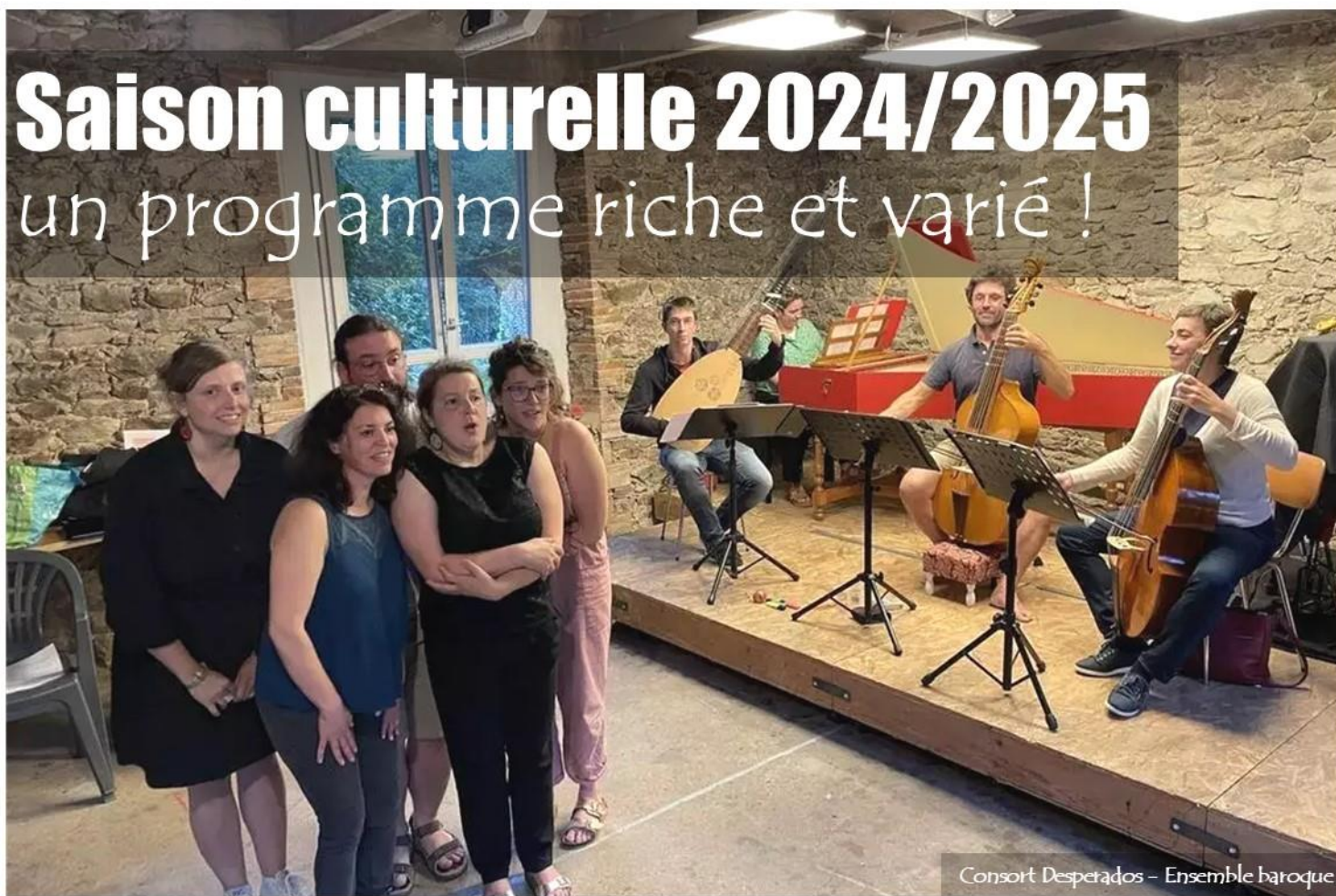
Consort Desperados – Ensemble baroque

La nouvelle saison culturelle 2024/2025 de La Séguinière s'annonce sous les meilleurs auspices, avec une programmation éclectique et conviviale qui saura séduire aussi bien les petits que les grands. Marquée par des événements artistiques de qualité, des spectacles divertissants et des rendez-vous incontournables, cette saison promet de rythmer l'année à venir avec des moments de partage et de découverte pour tous les habitants.