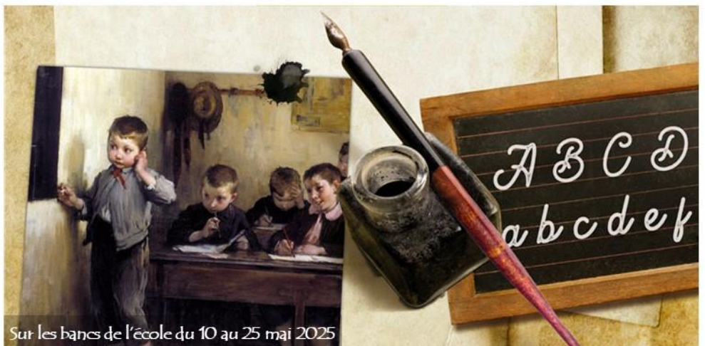
Sur les bancs de l'école du 10 au 25 mai 2025

La commission culture garde également la porte ouverte à d'autres projets tout au long de la saison. Des spectacles supplémentaires pourraient voir le jour, notamment grâce aux résidences d'artistes à l'espace Prévert, offrant ainsi encore plus de surprises à venir.