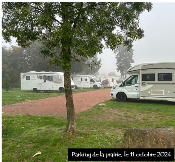
Parking de la prairie, le 11 octobre 2024

L'aire de La Prairie, avec ses services adaptés, son cadre agréable et la proximité des commerces, continue d'attirer une clientèle fidèle contribuant à l'économie locale et au dynamisme de la commune.